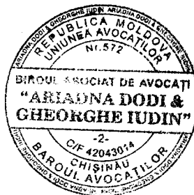
Ariadna Suveica (Dodi), avocat